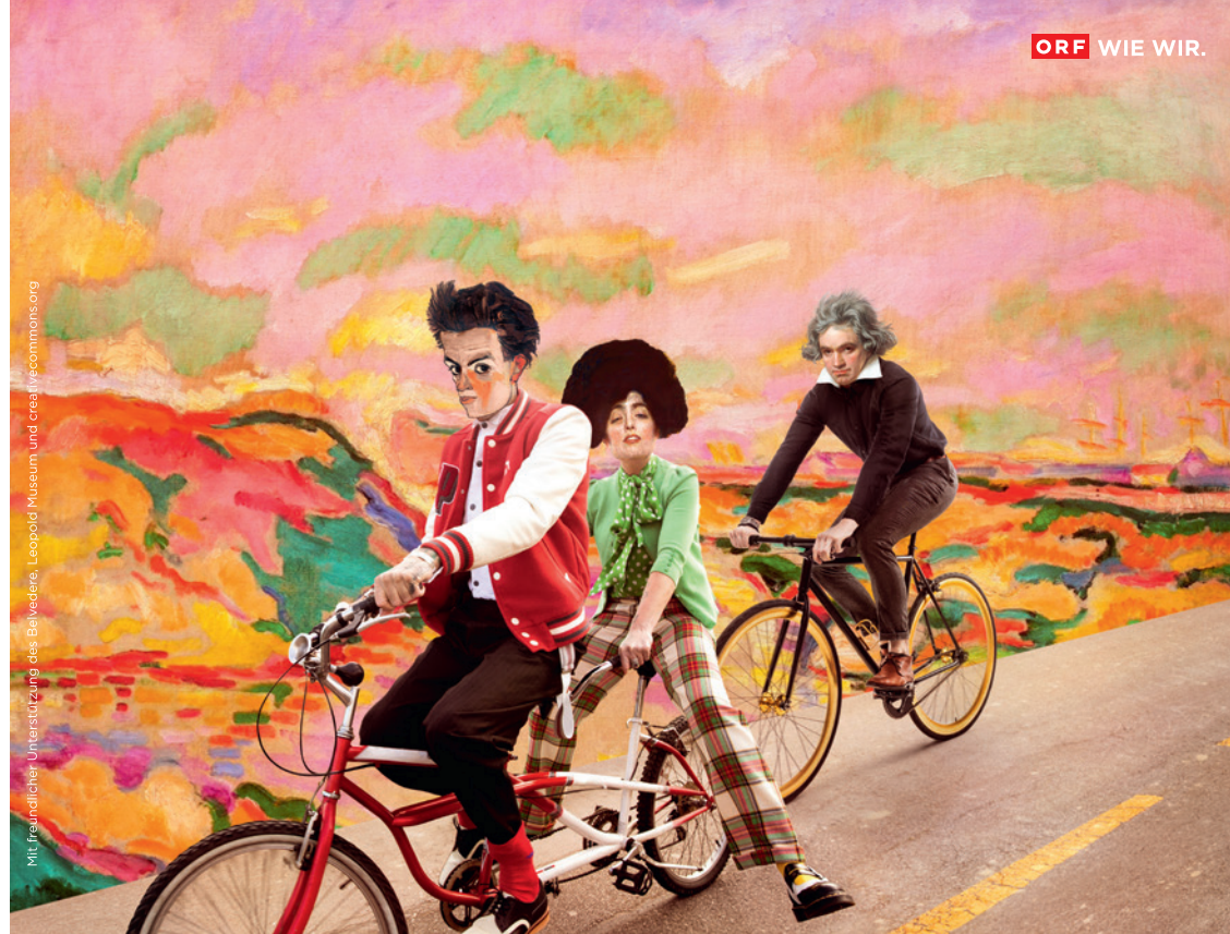
Mit freundlicher Unterstützung des Belvedere, Leopold Museum und creativescommons.org